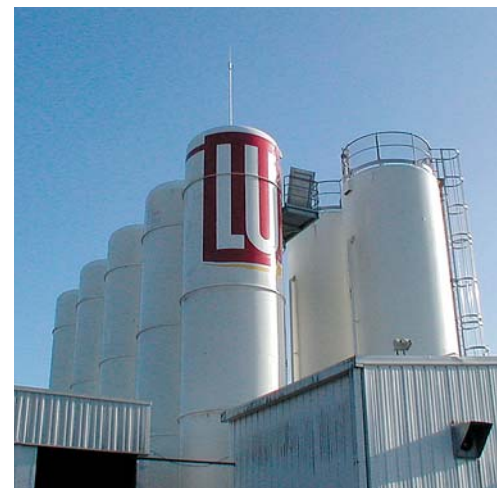
LU - Cestas (33)