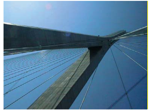
Pont de Normandie 1993