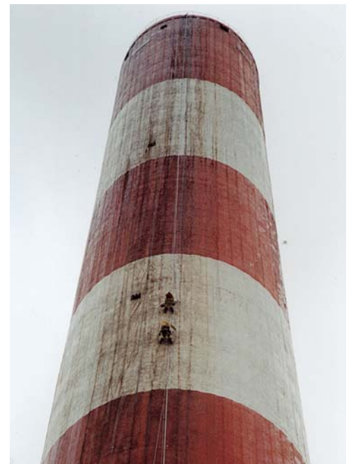
Centrale thermique - Cordemais (44)