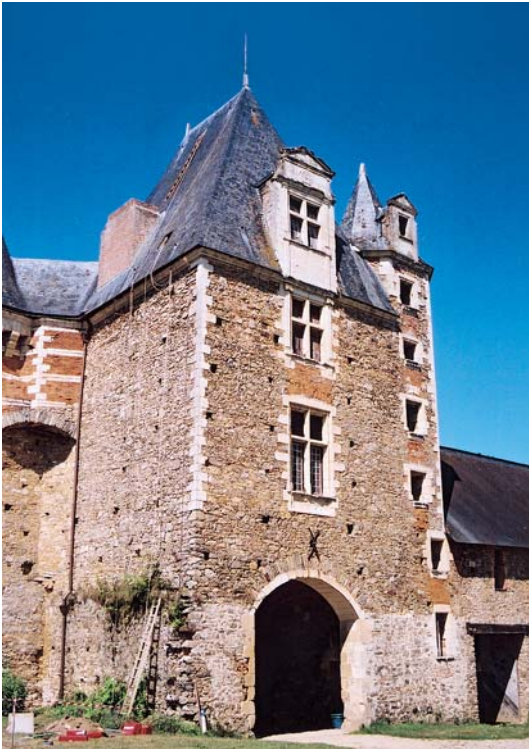
Château de Mortiercrolles (53)