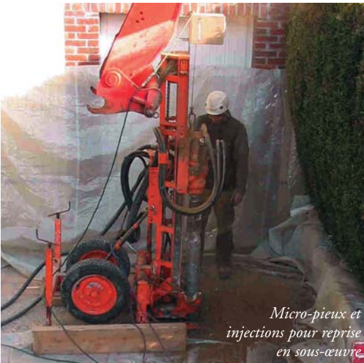
Micro-pieux et injections pour reprise en sous-œuvre