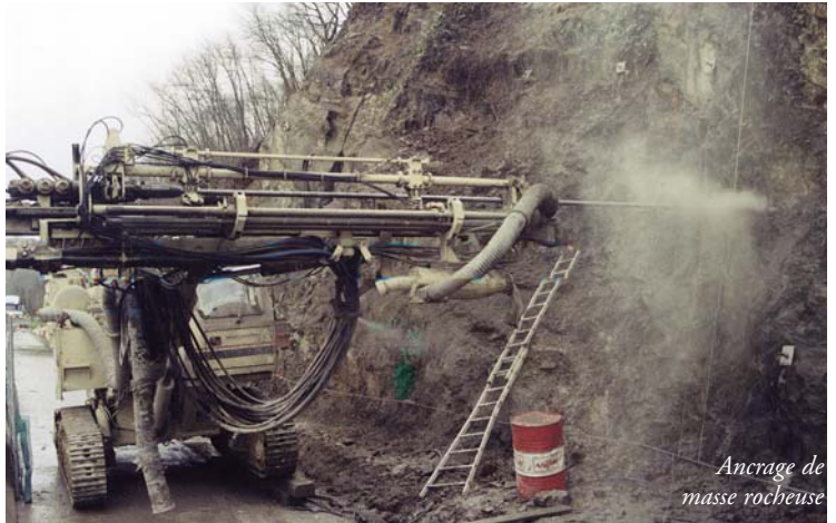
Ancrage de masse rocheuse

Mise en œuvre d'instrumentations pour surveillance de masses rocheuses, d'ouvrages d'art ou de bâtiments instables.