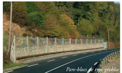
Pare-blocs de type géobloc