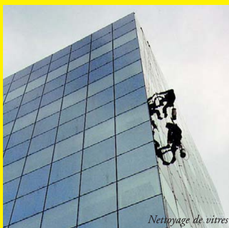
Nettoyage de vitres

Interventions de maintenance en milieu urbain sur ouvrage d'art, ouvrage de génie civil, monuments classés ou traditionnels.